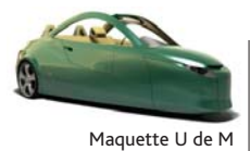
Maquette U de M

Quest Enterprise, une compagnie basée au Tennessee, a mandaté l'ITAQ pour qu'il agisse à titre de maître d'œuvre dans un projet de conception d'un véhicule électrique ultra-efficace. Le projet d'une durée de huit mois a été réalisé de concert avec l'École Polytechnique, l'Université McGill, l'École de design industriel de l'Université de Montréal et l'École de design de l'UQAM. L'ITAQ a fourni une assistance technique et offert son expertise en ingénierie automobile aux universités partenaires. Ce projet démontre une fois de plus que le Québec dispose des atouts nécessaires pour le développement d'un pôle en transport terrestre écologique, tant au niveau de l'ingénierie que du design.